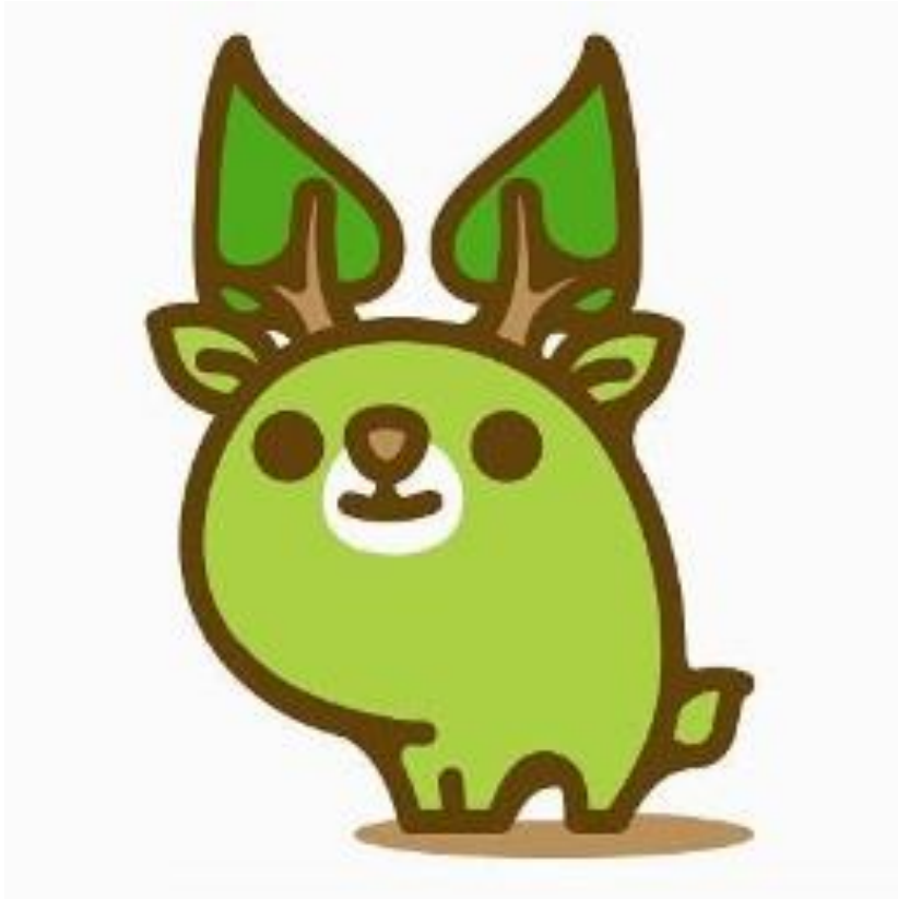
奈良県エコキャラクター な~らちゃん